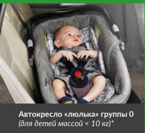
Автокресло «люлька» группы 0 (для детей массой < 10 кг)*

При покупке детского удерживающего устройства обязательно следует уточнить у продавца наличие сертификата на товар!