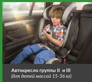
Автокресло группы II и III (для детей массой 15-36 кг)