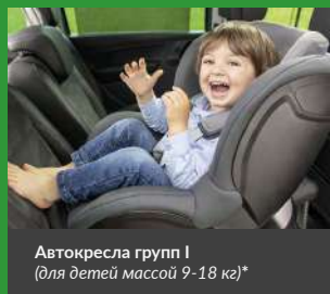
Автокресла групп I (для детей массой 9-18 кг)*